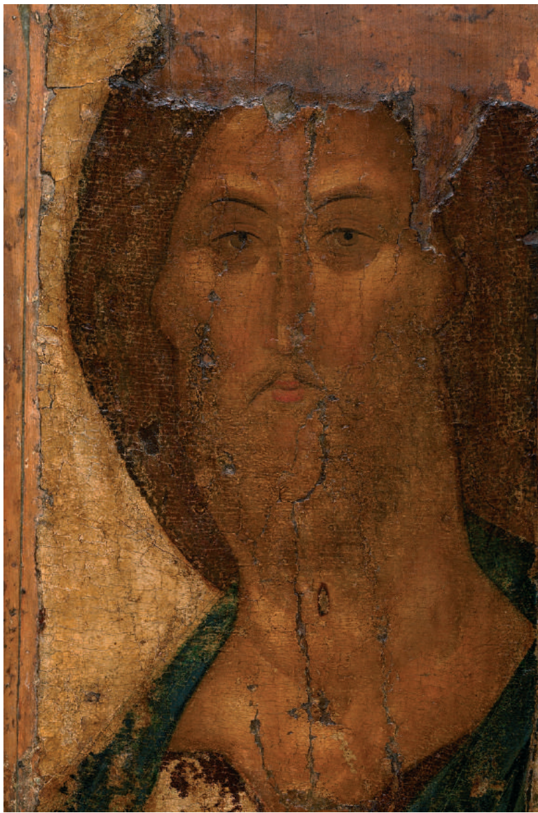
圣像：为众天军所环绕之基督