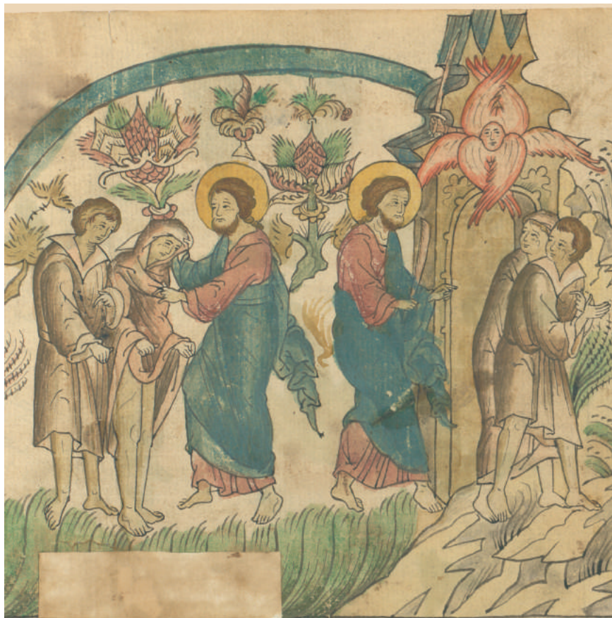
亚当与夏娃被逐出乐园