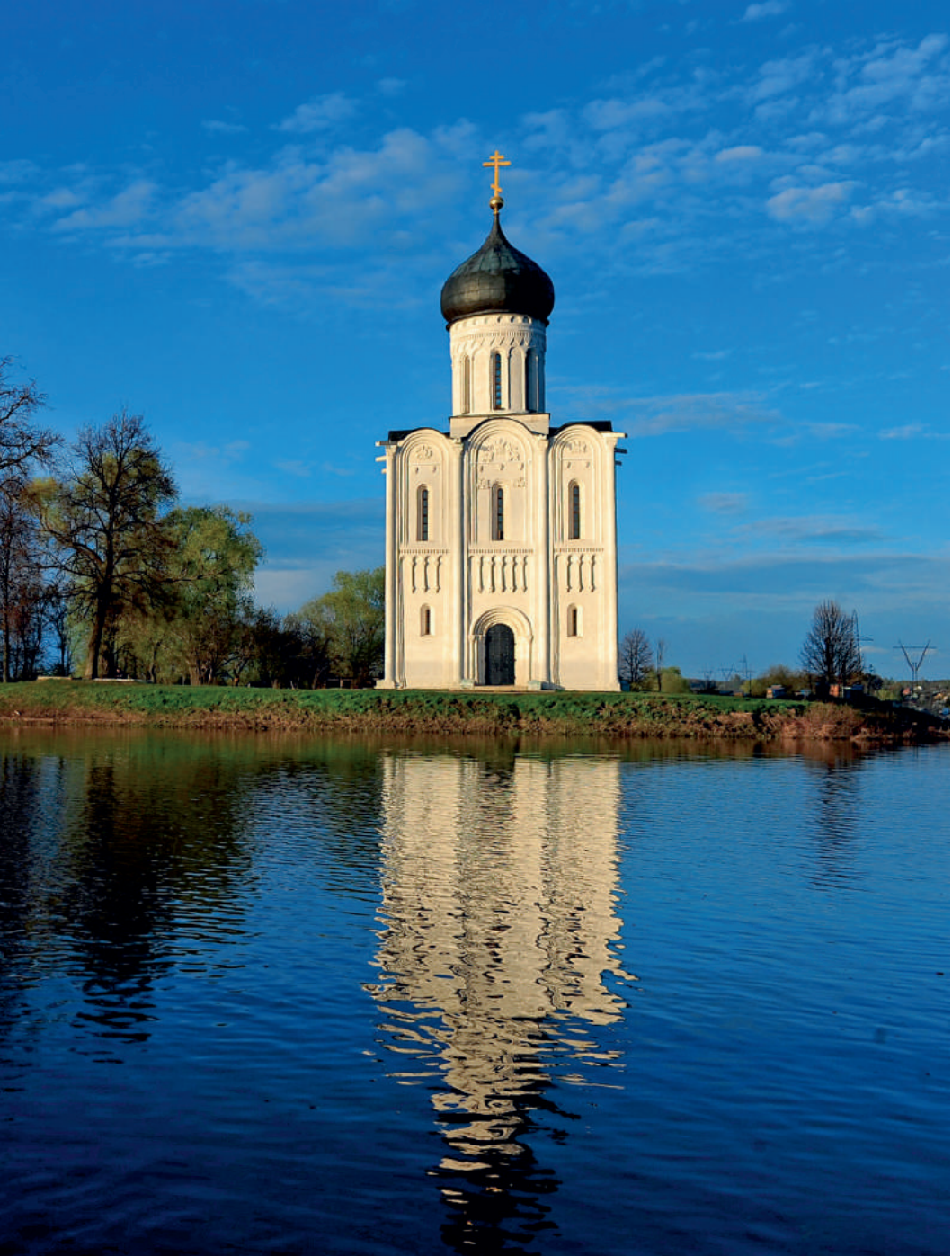
涅尔利圣母卍幪教堂